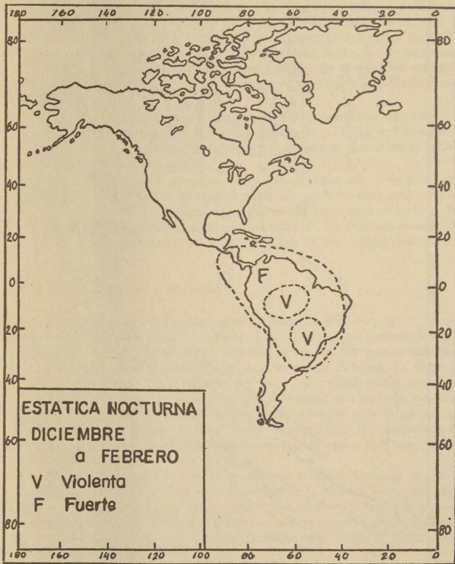
Fig. 2. Distribución de la estática en el Continente Americano durante los meses de invierno.